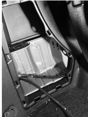
Figura 03: Faça a furação no box para fixar pela barra roscaada.

Figura 02: Fure a lataria e fixe a barra roscaada neste furo.