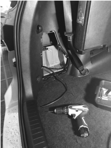
Figura 02: Fure a lataria e fixe a barra roscaada neste furo.

Figura 01: retire a tampa plástica conforme figura abaixo. Passe a fiação.