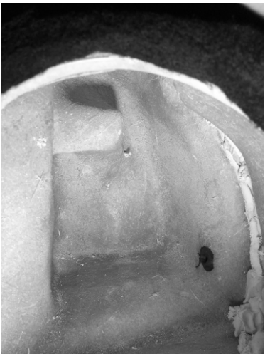
Figura 04 e 05: Rosqueie uma porca para melhor fixação.

Figura 03: Faça a furação no box para fixar pela barra roscaada.